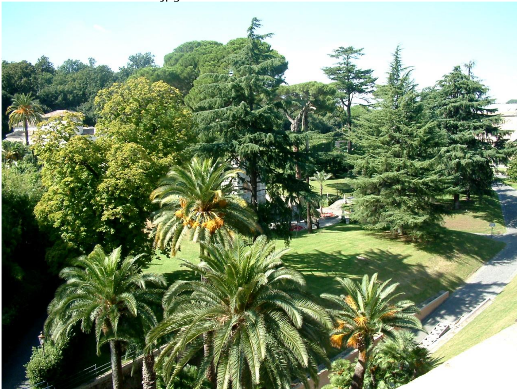
File: Ograd papieski.jpg unter Wikimedia Commons